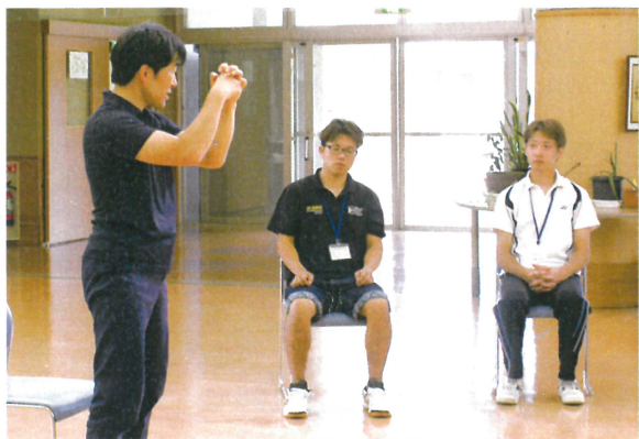
医療的ケアの演習