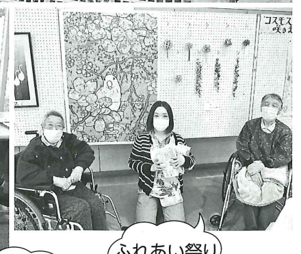
ふれあい祭り作品