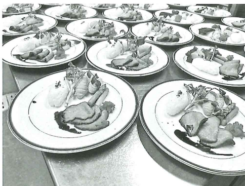
ローストビーフ（ライス添え）

その後、何か歌を歌おうかという話になり、急遽「見上げてごらん夜の星を」を歌いました。入居者の皆さんも知っている曲であり、□さんでくださる方々が多数見受けられました。 最後には、私が独断と偏見で選んだ、クリスマスプレゼントをくじ引きにて、看護師サンタクスより皆様へお渡ししました。 インターネット環境のある皆様におかれましては、「アーベイン八幡平 ブログ」と検索していただければ早く見つけることができると思いますので、ぜひ閲覧していただければと思います。