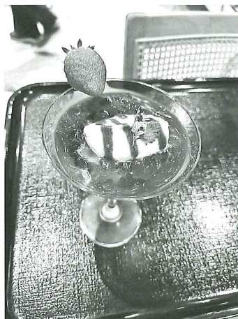
普通食が難しい方へのデザート