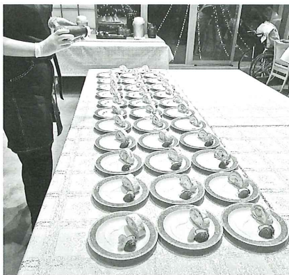
入居者の前でデザートを作ってます