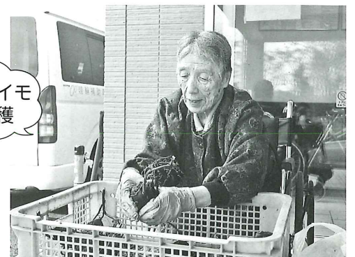
サツマイモの収穫